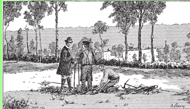
Fig. 1 : Premiers sondages effectués sur le site de La Coulonche au XIX e siècle (gravure d'après Appert, Challemel 1893).

L'officine de faux-monnayeurs de La Coulonche (Orne) : nummi coulés de la Tétrarchie en Occident By JÉRÉMIE CHAMEROY et PIERRE-MARIE GUIHARD