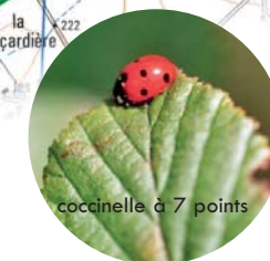
coccinelle à 7 points